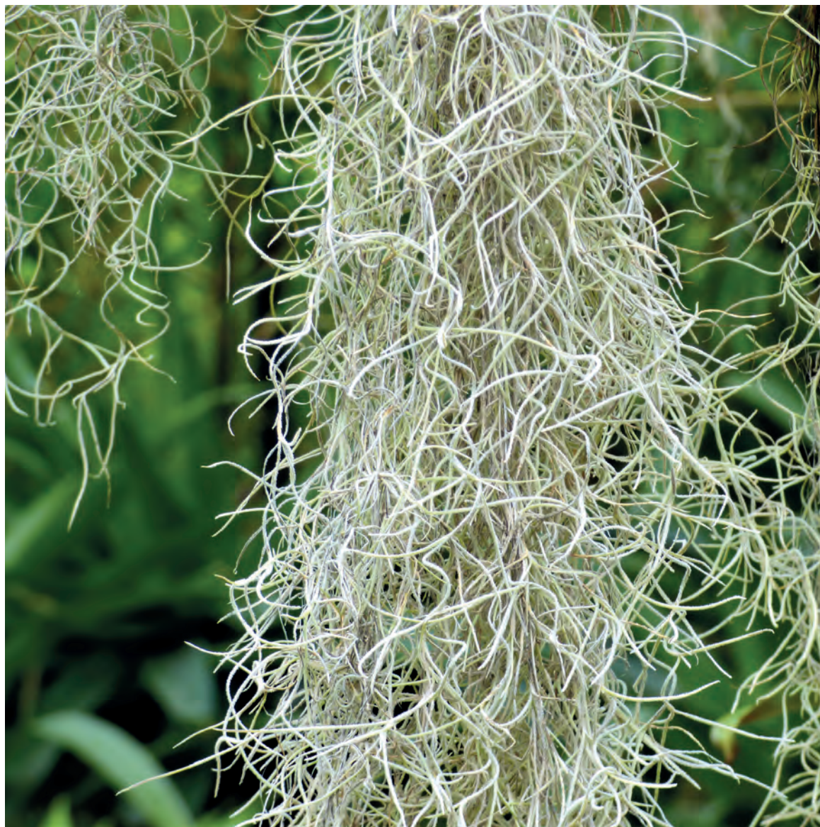
Figura 19. T. usneoides cultivada en La Rinconada, Santa Cruz (Andira)