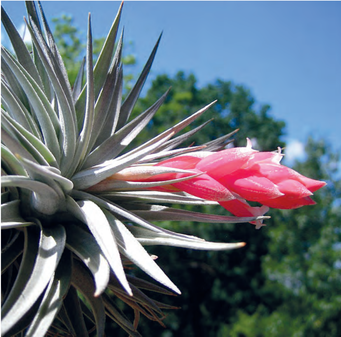
Figura 12. T. recurvifolia en la zona urbana de Santa Cruz. (Andira)