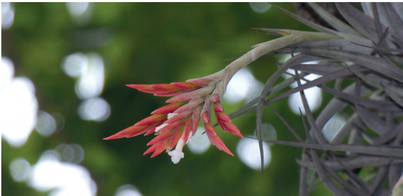
Figura 11. T. vernicosa en bosque seco chaqueño (Virna Abrego)

Presente en Bolivia (hasta los 2.500 m) en bosque semideciduo chiquitano, bosque seco chaqueño, serrano y valles secos.