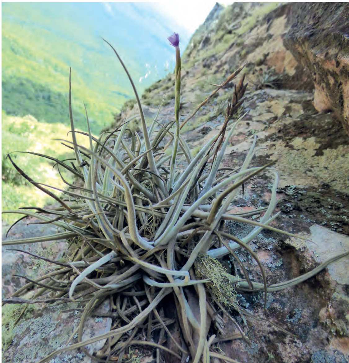
Figura 22. T. reichenbachii sobre roca en Tucabaca (Andira)