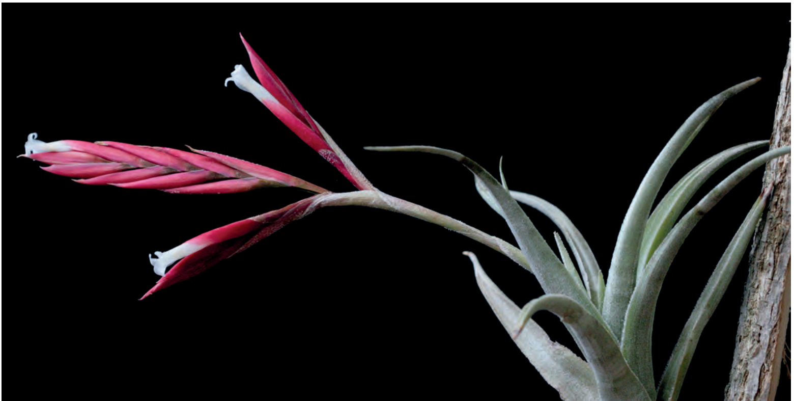
Figura 8. T. lorentziana en cultivo

En Bolivia (hasta los 3.000 m), crece principalmente en valles secos, pero también en áreas rocosas de la Chiquitanía y del Chaco.