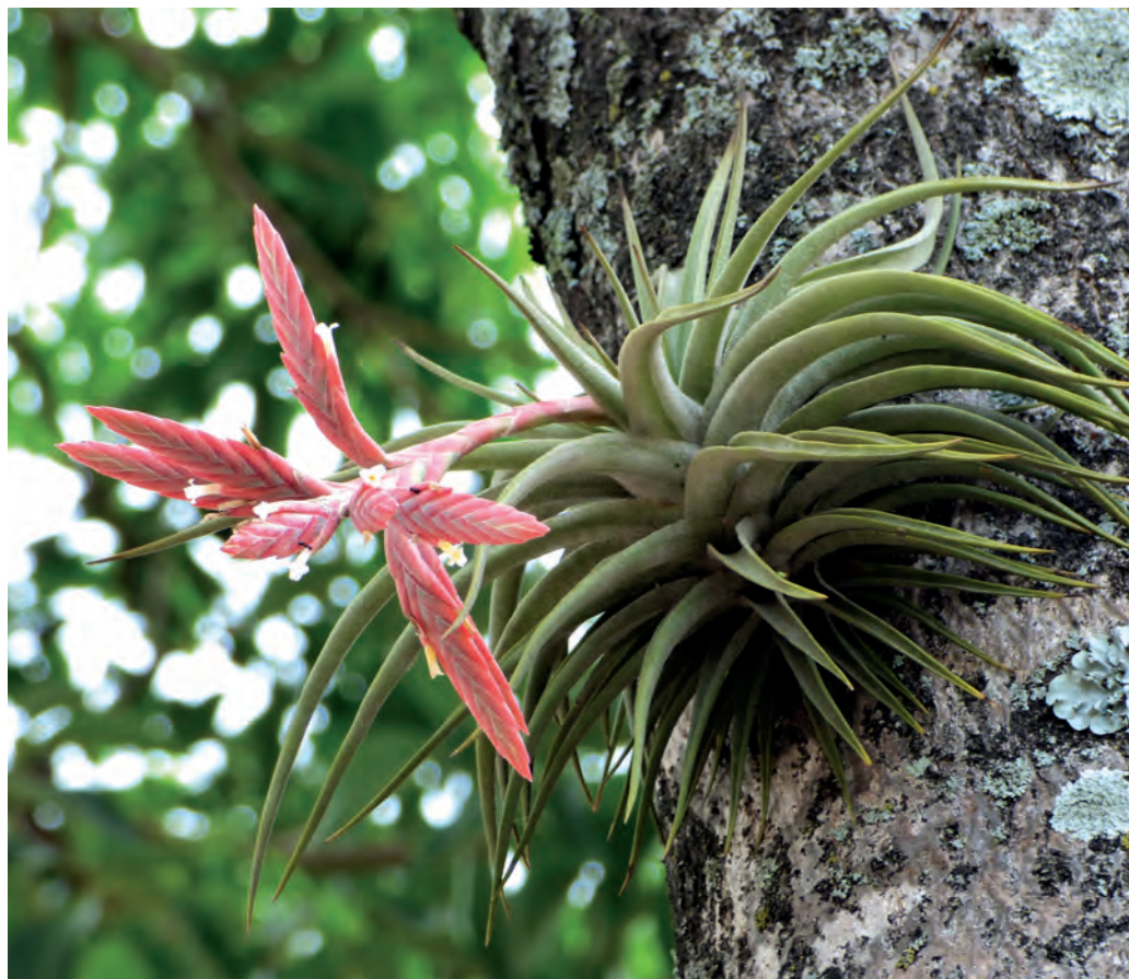
Figura 7. T. didisticha creciendo sobre tajibo (Andira)

Epífita, arrosetada de tallo corto, mediana (15-20 cm). Presenta hojas amplias en la base que se van adelgazando en el ápice, y cubiertas de tricomas.