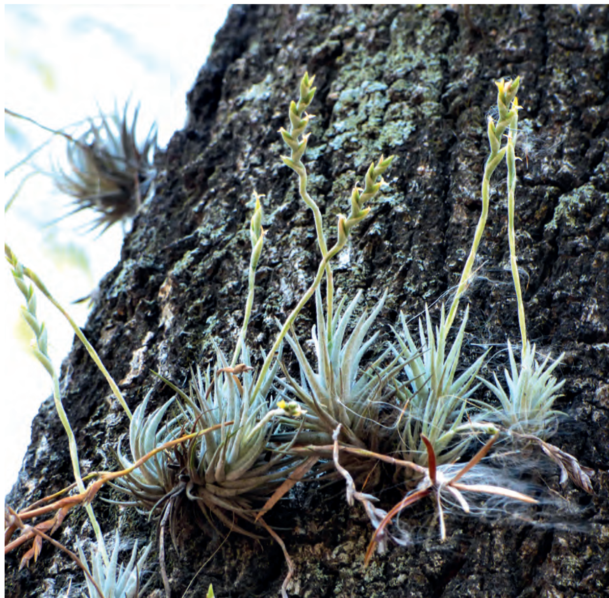
Figura 15. T. loliacea sobre árbol de tajibo ( Andira )