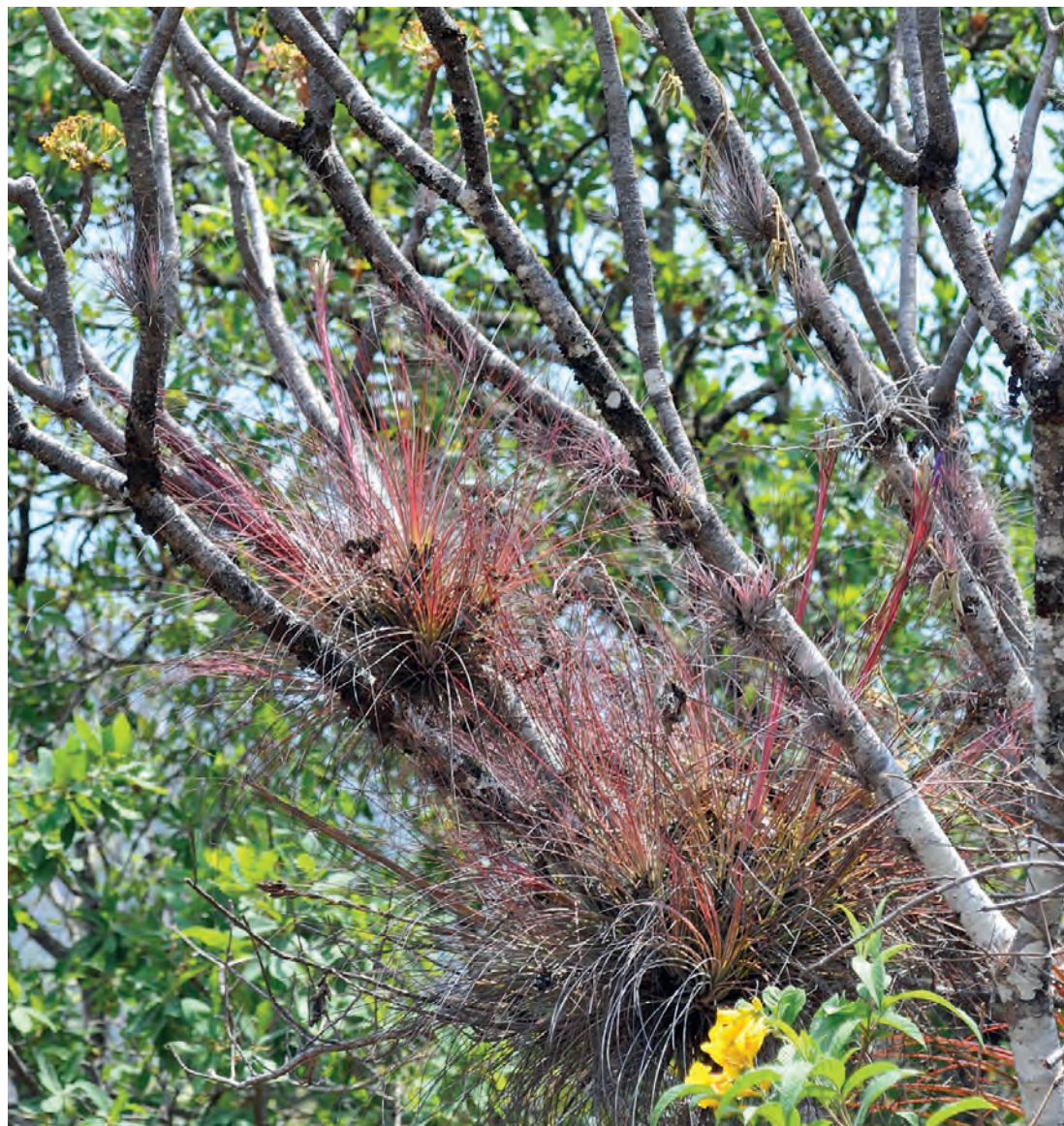
Figura 25. T. juncea en Sierra Juarez Oaxaca - Mexico (Ichiro Ueno)