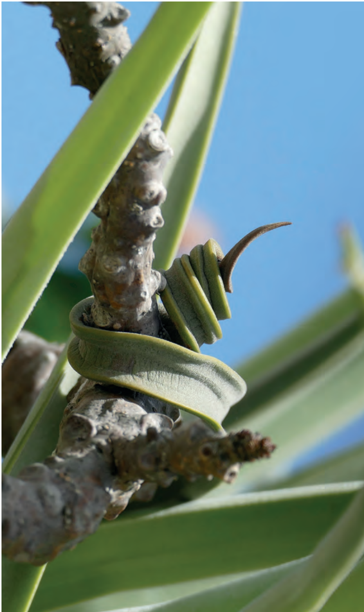
Figura 1. Hojas de T. duratii con extremos envolventes (D. Rumiz)

Las hojas cumplen varias funciones, ya que, además de la fotosíntesis y el intercambio gaseoso a través de los estomas, también intervienen en la captación de agua y nutrientes como lo haría una raíz. En las especies de claveles del aire, la superficie de las hojas está cubierta de tricomas, que son pelos o escamas epidérmicas que protegen las hojas de la radiación solar y desecación y le dan su color gris. Los tricomas de Tillandsia son células prematuramente muertas, que forman un disco central rodeado por un anillo con 'alas' erectas cuando están secas (Fig. 2 a).