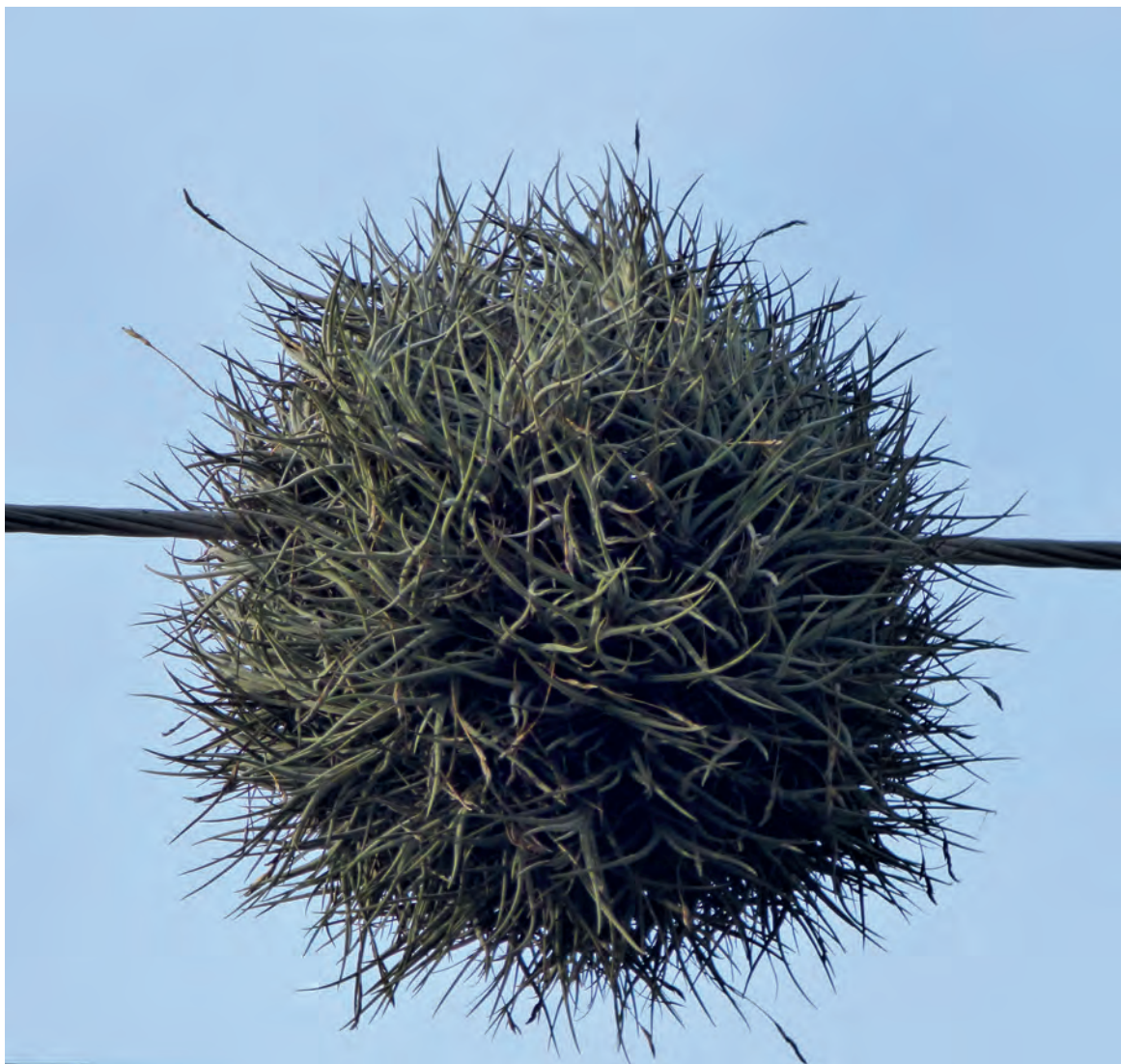
Figura 17. T. recurvata sobre el tendido eléctrico en la ciudad de Santa Cruz (Andira)

Distribución amplia en Bolivia (hasta los 3.500 m) está presente bosque semideciduo chiquitano, bosque seco chaqueño, campos cerrados, bosque boliviano tucumano, bosque serrano chaqueño y valles secos.