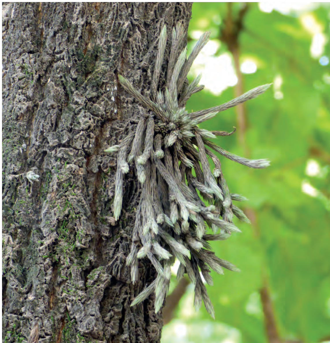
Figura 16. T. minutiflora sobre un tajibo en la ciudad de Santa Cruz. (Andira)

N.c.: clavel del aire, angelito, tillandsia.