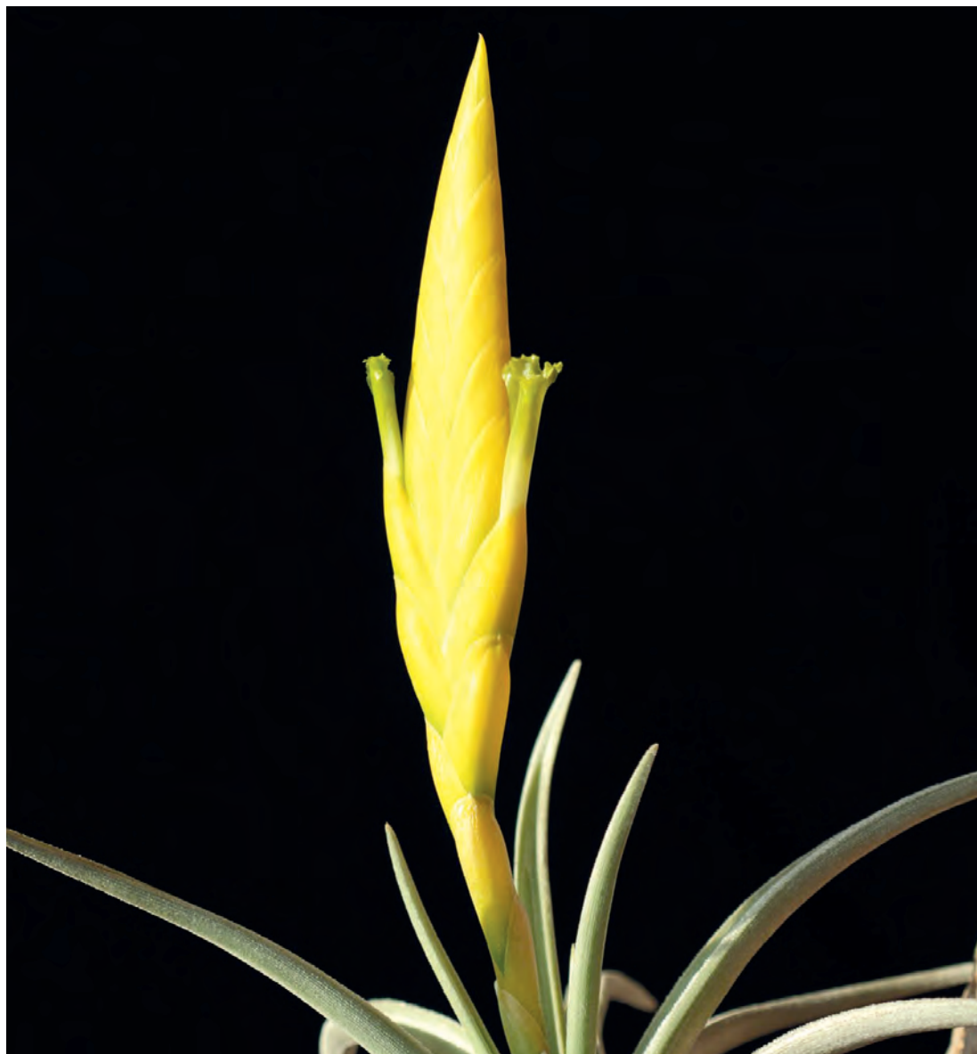
Figura 9. T. lotteae en cultivo