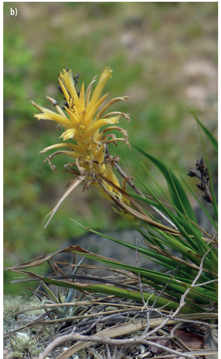
Figura 6. a) Representantes de la subfamilia Bromelioidea ( Bromelia sp.) y b) Pitcairnioideae ( Pitcairnia mohamadii ) (Andira)