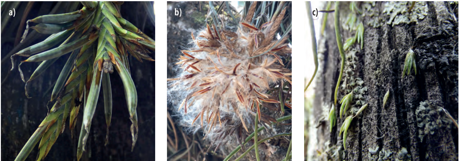
Figura 4. a) Frutos inmaduros de T. didisticha , b) semillas con indumento para dispersión, y c) semillas establecidas iniciando las plántulas (Andira).

lo que logran a través de la fotosíntesis con energía de la luz solar. Este proceso tiene lugar en los tejidos donde está la clorofila, se compone de varias etapas químicas y requiere condiciones de luminosidad, suministro de agua y temperatura adecuadas. La mayoría de las plantas conocidas capturan en un paso el dióxido de carbono ( \text{CO}_2 ) que entra por los estomas y forman un compuesto de tres carbonos que luego se convertirá en glucosa. Este sistema metabólico se conoce como ' carbóno 3' (C3) y está presente en las plantas de zonas templadas, incluyendo las tillandsias, pero no es viable cuando hay escasez de agua y elevada temperatura. Otros sistemas metabólicos que evolucionaron bajo distintas condiciones ambientales son el llamado ' carbóno 4' (C4), que es ventajoso con alta insolación, y el del metabolismo ácido de las