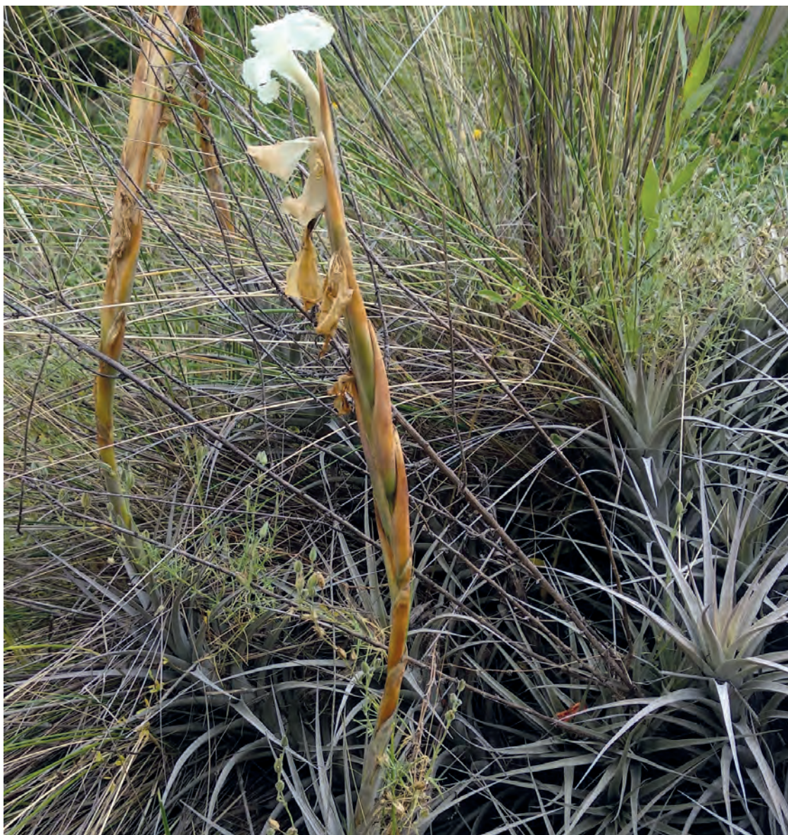
Figura 10. T. prolata en Cota Cota- La Paz (Yamil Maidana)