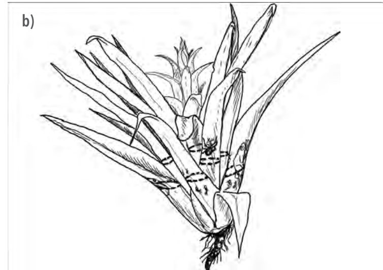
Figura 2. a) Tricoma epidérmico de un clavel del aire gris, b) planta con tanque o fitotelmata (Sixto Angulo)