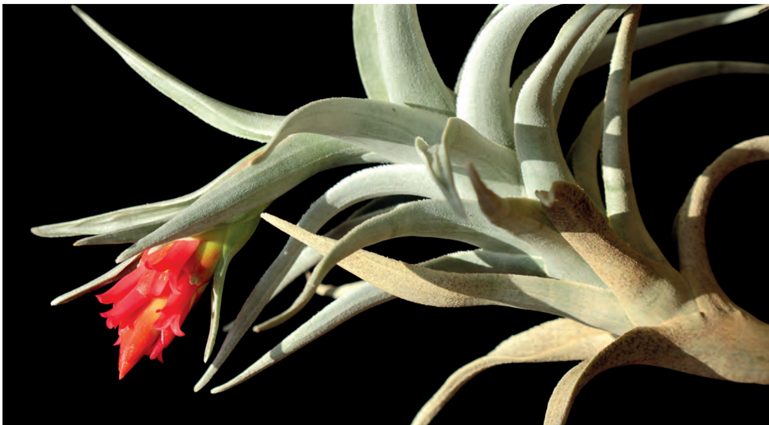
Figura 24. T. edithae en cultivo

Endémica de Bolivia (desde los 500 hasta los 3.000 m) presente en bosque semidecíduo chiquitano, bosque boliviano tucumano y valles secos, en La Paz, Santa Cruz y Chuquisaca.