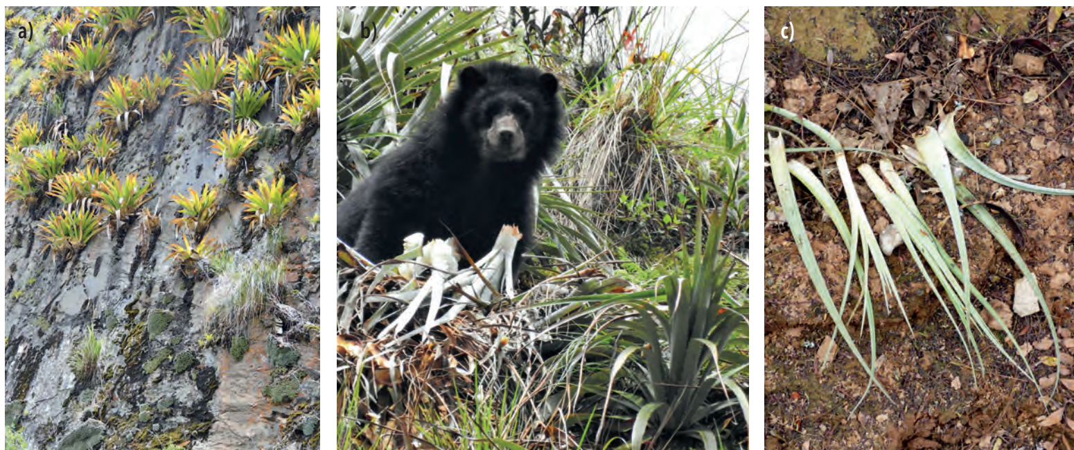
Figura 5. a) Plantas de T. australis creciendo en farallones (Ximena Velez), b) oso comiendo hojas de bromeliáceas (Birdnerds Bolivia-Jukumari Lodge), c) hojas de un clavel gris ( T. lorenziana ) comidas por el mono martín (D. Rumiz)

Las grandes tillandsias y otras bromeliáceas 'tanque' constituyen un reservorio de agua en lo alto de los árboles o en farallones rocosos creando micro-ecosistemas acuáticos o 'fitotelmata' que son el hábitat para muchos insectos, otros invertebrados, ranas, lagartijas y pequeñas serpientes. Estas masas de epífitos son fuente de bebida y presas para aves, carachupas, monos y tejones, entre otros, y también son sitio de refugio y reproducción de pequeños vertebrados e invertebrados. Las tillandsias producen flores con néctar que son alimento para insectos y colibríes polinizadores, y las bases más tiernas de sus hojas son alimento de emergencia para monos y el jukumari en época seca.