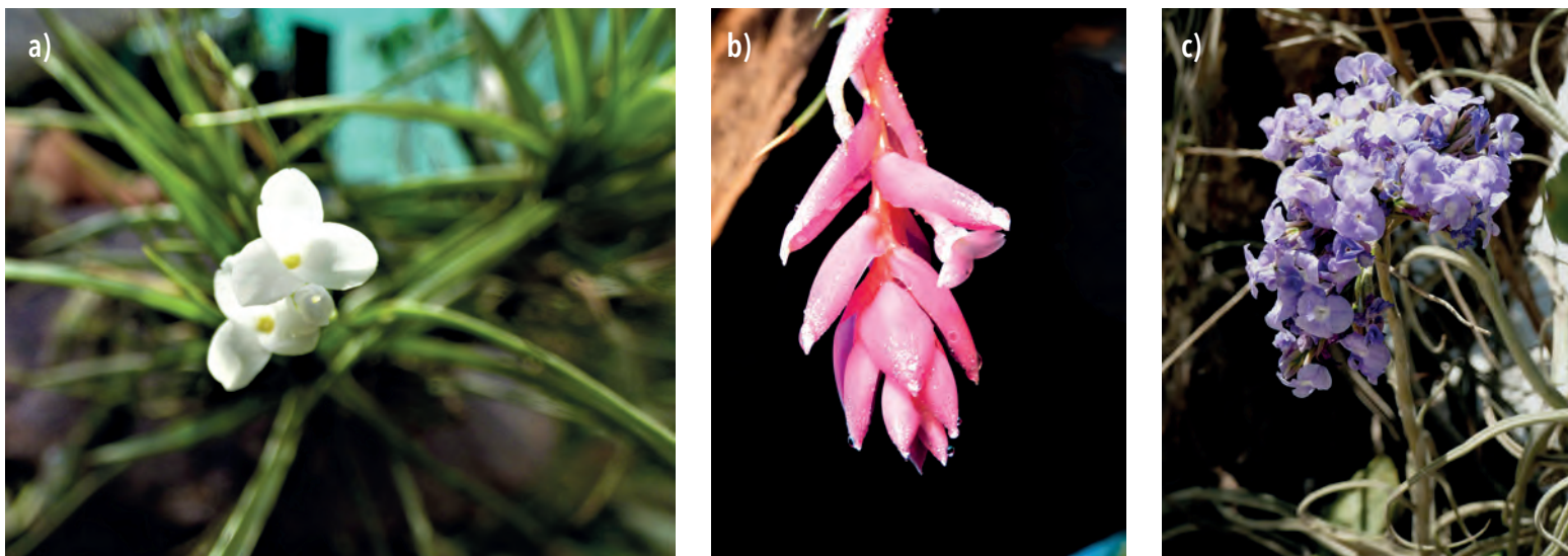
Figura 3. a) Flores de Tillandsia tenuifolia (Andira), b) de T. recurvifolia (Andira) y c) T. streptocarpa (D. Rumiz)

plumosa. Los picaflores también suelen visitar sus flores, sobre todo en aquellas de gran tamaño como Tillandsia samaipatensis .