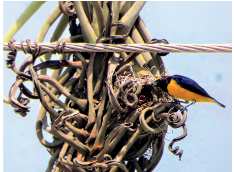
Figura 29. Planta de T. duratii en la ciudad de Santa Cruz donde anidan matiquitos Euphonia chlorotica (Andira)

Las funciones ecológicas de los claveles del aire en los bosques, que fueron descritas previamente, también se aplican en el entorno urbano donde contribuyen al sustento de la biodiversidad de insectos polinizadores, aves y otra fauna. Este enriquecimiento ambiental se puede comprobar también por el hallazgo de la construcción del nido de una vistosa ave en una planta de T. duratii (Fig. 29)