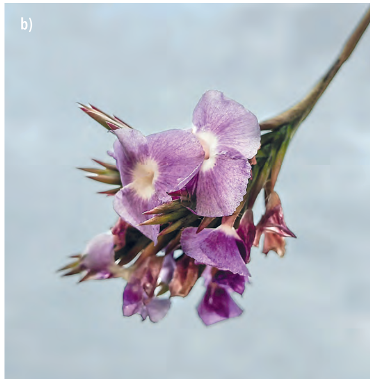
Figura 21. T. streptocarpa a) sobre tendido eléctrico en Santa Cruz (Andira) y b) detalle de la flor (Ericka Von Borries)