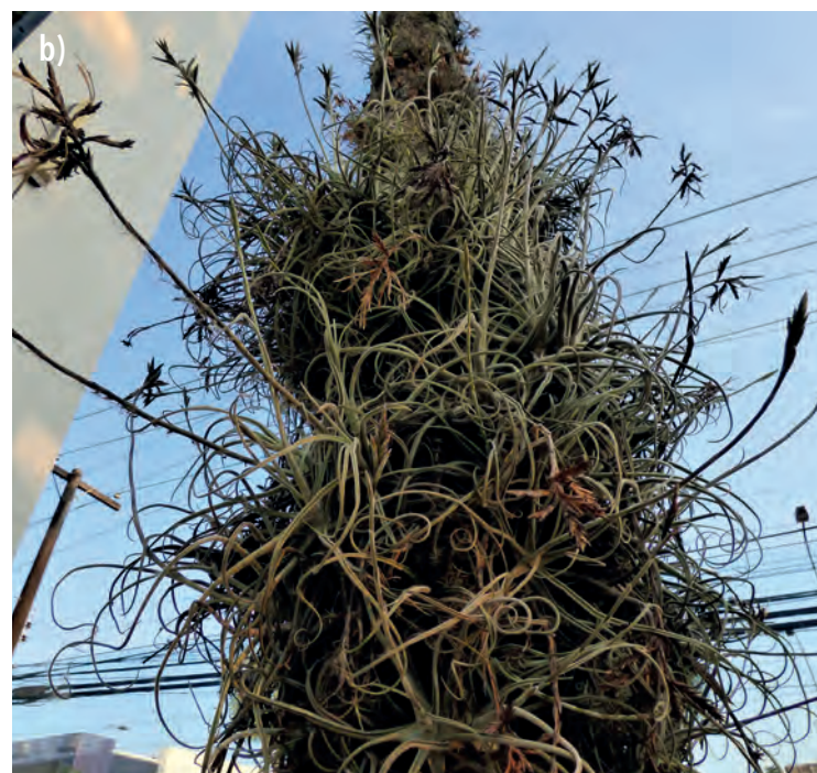
Figura 27. T. streptocarpa , especie muy frecuente en a) tendido eléctrico y b) en árboles (Andira)