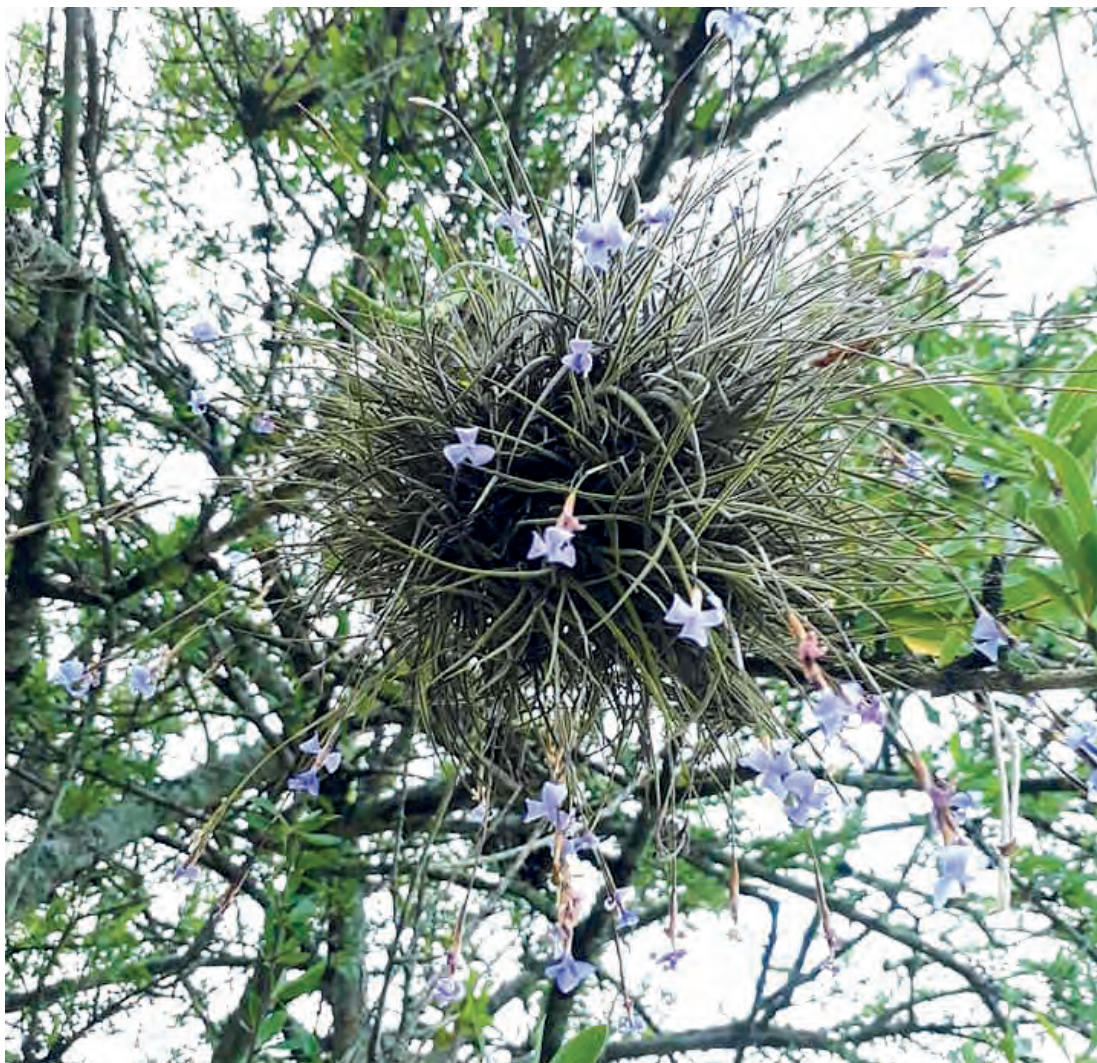
Figura 14. T. bandensis en el bosque chaqueño (Dario J. Baumgratz)