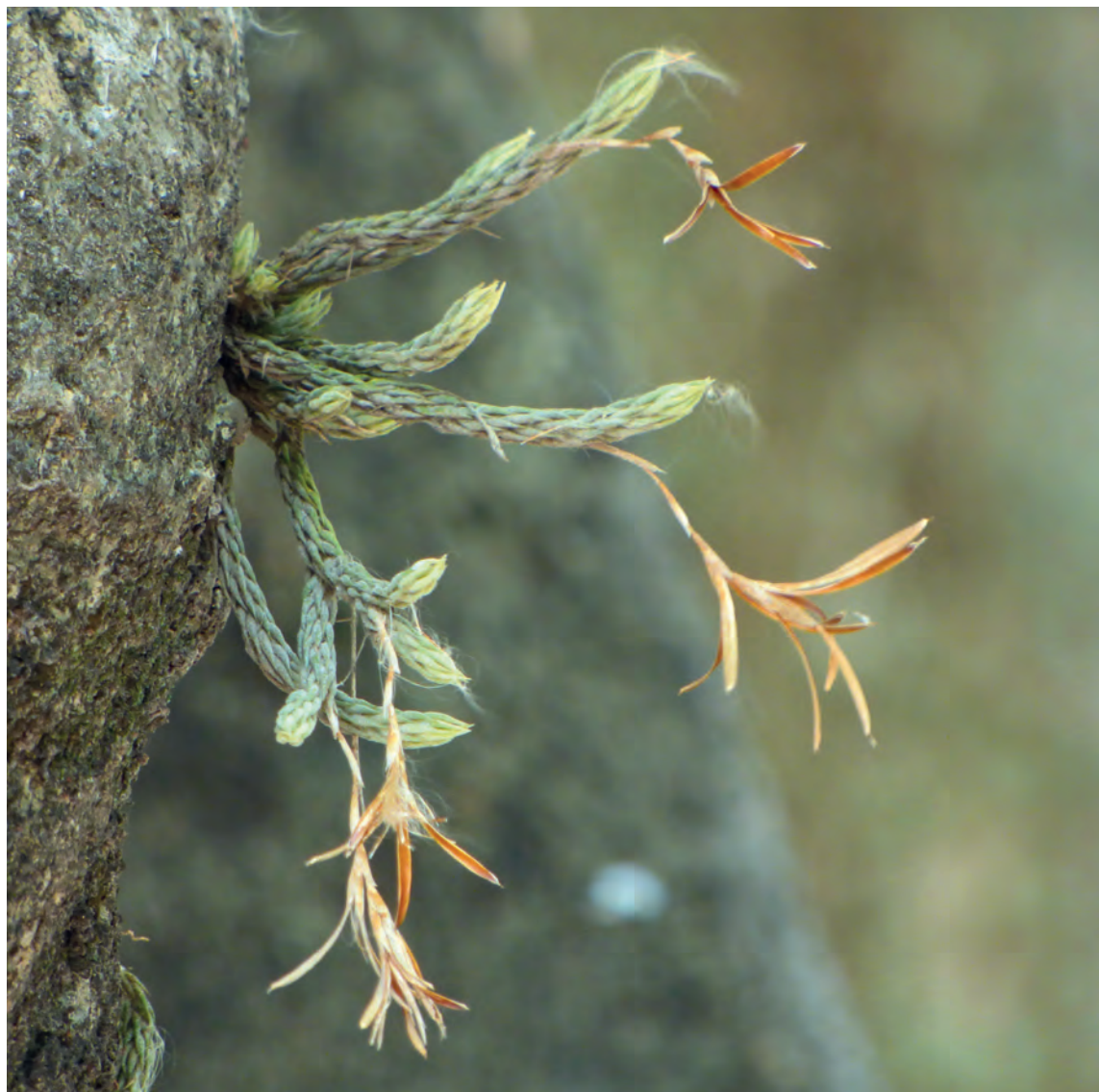
Figura 18. T. tricholepis creciendo sobre un árbol de tajibo en los alrededores de la ciudad de Santa Cruz. (Andira)

N.c.: clavel del aire, angelito, tillandsia.