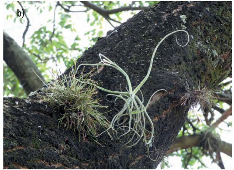
Figura 28. a) T. loliacea , b) T. recurvata y T. streptocarpa creciendo en la ciudad de Santa Cruz (Andira)

En algunos casos se puede interpretar su sobrepoblación como un aviso de problemas fitosanitarios del árbol hospedero, más que de un problema causado por las tillandsias, teniendo que evaluarse específicamente la causa con personal especializado para lograr la mejora del árbol y con el buen manejo, mantener la riqueza del género Tillandsia en la ciudad.