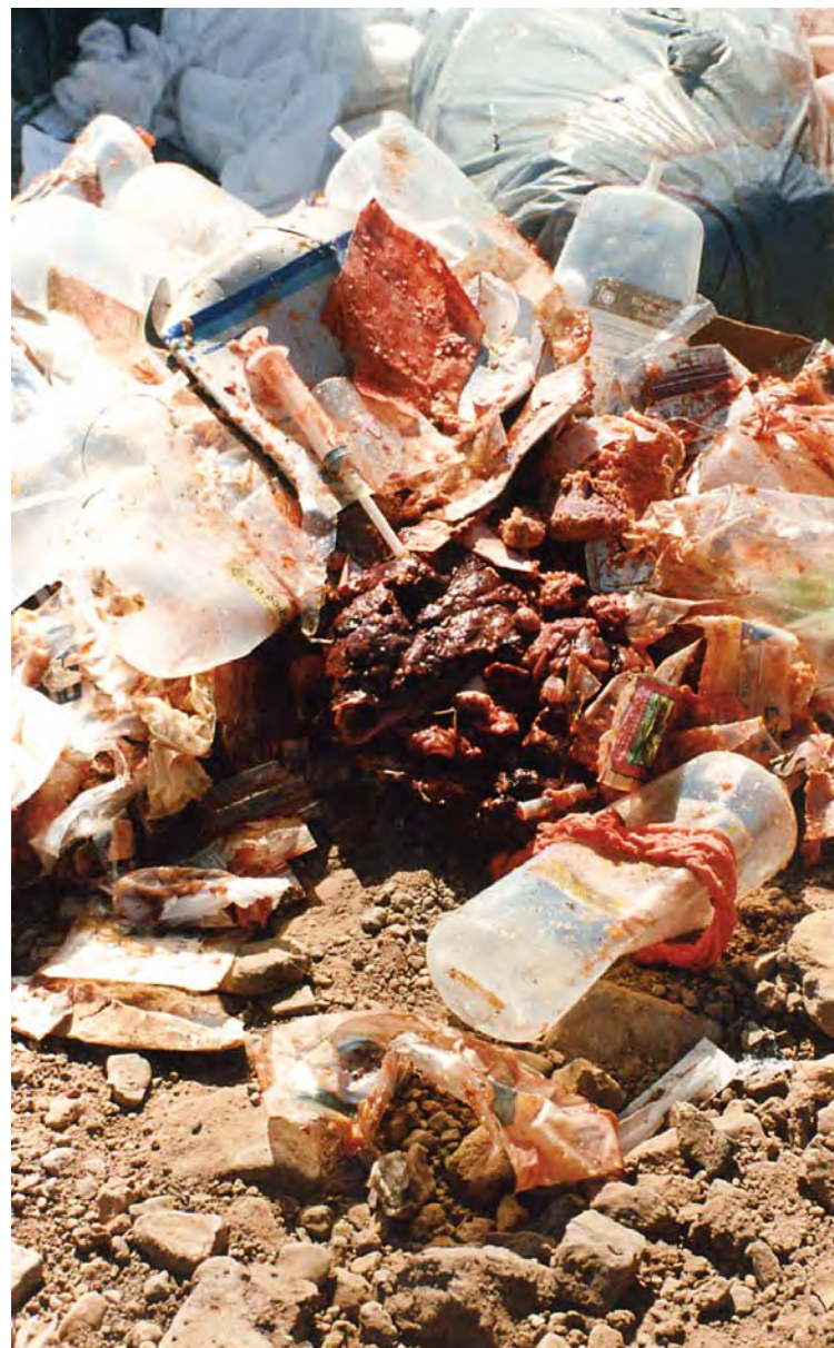
Residuos infecciosos mal dispuestos.