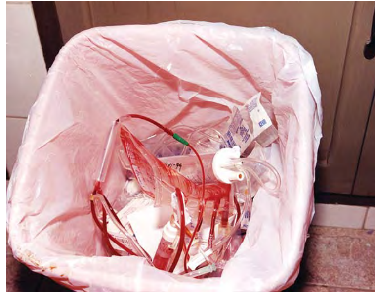
Residuos patógenos infecciosos.

Comprende sangre, suero, plasma y otros hemocomponentes provenientes de establecimientos de salud, gabinetes de transfusión, bancos de sangre, bolsas de sangre y equipos de transfusión con plazos de validez vencidos y muestras de sangre con serología positiva.