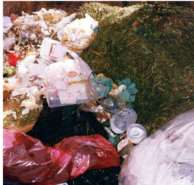
Inadecuada disposición final de residuos peligrosos hospitalarios.

y la disposición final de estos residuos hospitalarios, en especial si éstos son trasladados fuera de los hospitales sin la aplicación de las medidas de higiene y seguridad que requieren tales procesos. Situación crítica en instituciones de salud de primer nivel de atención, ubicadas principalmente en localidades donde por lo general no se cuenta con un servicio municipal apropiado de evacuación de residuos, siendo frecuente su disposición final a campo abierto o en cuerpos de agua.