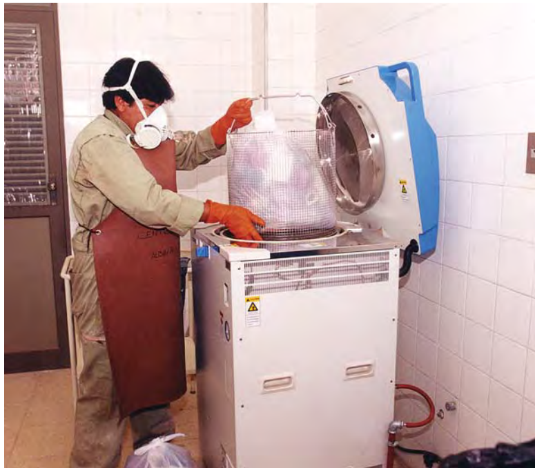
Sistema de autoclave utilizado en el Hospital Albina Patiño

Los residuos de alta densidad, como partes de cuerpos y cantidades grandes de material animal o de fluidos, dificultan la penetración del vapor y requieren un tiempo más largo de esterilización.