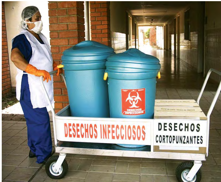
Carritos manuales de recolección de residuos hospitalarios peligrosos

La recolección por medio de carros, se realizará en establecimientos de salud más complejos, como son los de Nivel III de Atención.