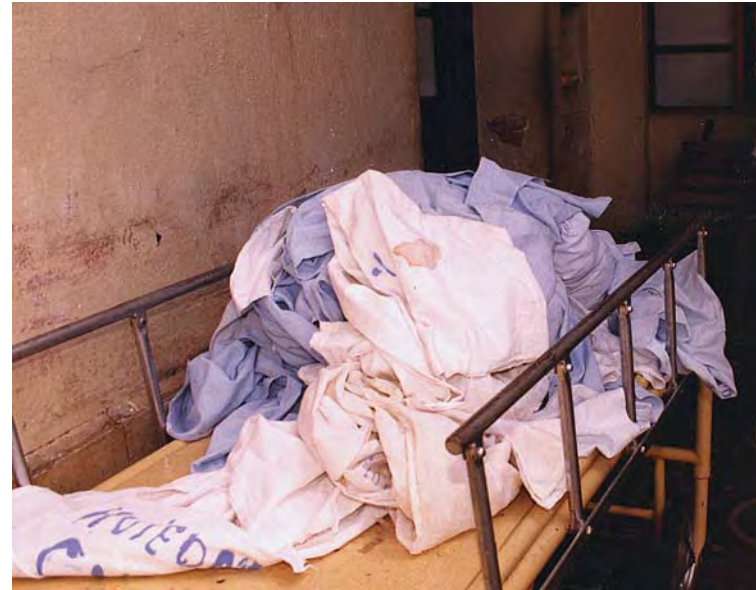
Residuos contaminados (sub clase A-6).

En sus características son similares a los residuos domésticos y los asimilables a esta categoría son provenientes de las oficinas administrativas, cocina, cafetería, garaje, espacios abiertos y jardines de los establecimientos de salud.