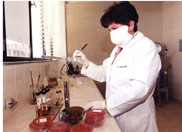
Residuos patógenos infecciosos.