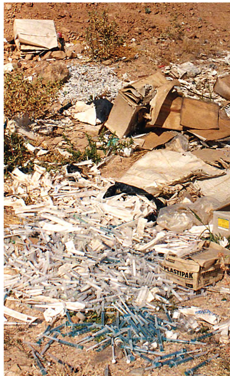
Indebida disposición final de corto punzantes.